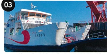
フェリーなんきゅう山川営業所 【住所】指宿市山川金生町38-1 【TEL】0993-34-0012 【営業時間】7:30~17:00 (天候により臨時休業あり) 【アクセス】鹿児島ICからクルマで約1時間20分