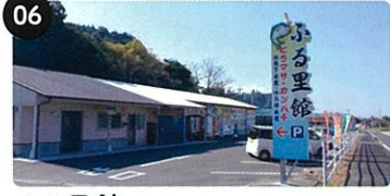
ふる里館 【住所】肝属郡錦江町神川780-1 【TEL】0994-22-2100 【営業時間】8:00~18:00 (第2・4・8・12月除く、1月1日~4日) 【アクセス】笠之原ICからクルマで約40分