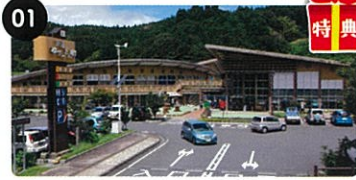
道の駅 川辺やすらぎの郷 【住所】南九州市川辺町清水6910 【TEL】0993-58-3131 【営業時間】8:00~19:00 (年中無休) 【アクセス】川辺ICからクルマで約10分 【特典】ソフトクリーム50円引き