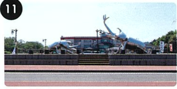
道の駅くにの松原おおさき 【住所】曾於郡大崎町神領2419 【TEL】099-471-6666 【営業時間】24時間営業 (年中無休) 【アクセス】大崎ICからクルマで約10分