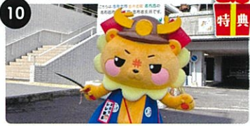
志布志市役所 【住所】志布志市志布志町志布志2-1-1 【TEL】099-472-1111 【営業時間】8:30~17:15 (土日祝定休) 【アクセス】志布志ICからクルマで約10分 【特典】志布志市よりちゅびり志をプレゼント(オリジナルカード)