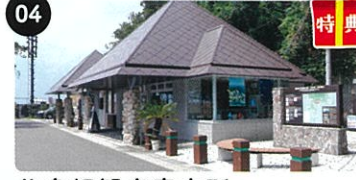
佐多岬観光案内所 【住所】肝属郡南大隅町佐多馬籠417 【TEL】0994-27-3151 【営業時間】9:00~17:00 (年中無休) 【アクセス】笠之原ICからクルマで約1時間30分 【特典】ソフトクリーム100円引き