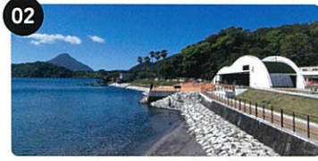
IKEDAKO PAX (展望台) 【住所】指宿市池田5123-7 【TEL】0993-23-1411 【営業時間】9:00~18:00 (年中無休) 【アクセス】鹿児島ICからクルマで約60分