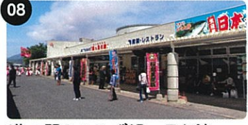
道の駅たるみず湯っ足り館 【住所】垂水市牛根麓1038-1 【TEL】0994-34-2237 【営業時間】9:00~19:00 (年中無休) 【アクセス】国分ICからクルマで約30分