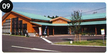
道の駅すえよし四季祭市場 【住所】曾於市末吉町深川11051-1 【TEL】0986-79-1900 【営業時間】9:00~18:00 (1月1日と4月7月10月の第1水曜日) 【アクセス】末吉財部ICからクルマで約5分