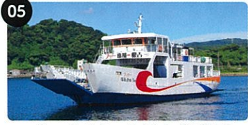
フェリーなんきゅう根占営業所 【住所】肝属郡南大隅町根占川南721-20 【TEL】0994-24-2531 【営業時間】8:00~17:00 (天候により臨時休業あり) 【アクセス】笠之原ICからクルマで約50分