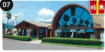
鹿屋市観光総合物産センター 【住所】鹿屋市西原3-11-1 【TEL】0994-41-7010 【営業時間】9:00~17:00 (年中無休) 【アクセス】笠之原ICからクルマで約20分 【特典】鹿屋市キャラクターシールプレゼント