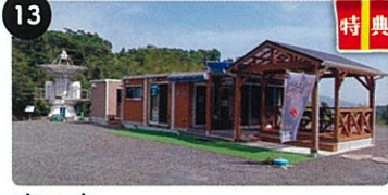
宙の家 【住所】肝属郡肝付町南方1870-10 【TEL】0994-45-7371 【営業時間】10:00~16:30 (水曜日定休) 【アクセス】笠之原ICからクルマで約40分 【特典】およぶめの皇山温泉ドーム入浴券(50枚限定)-肝付町ステッカープレゼント